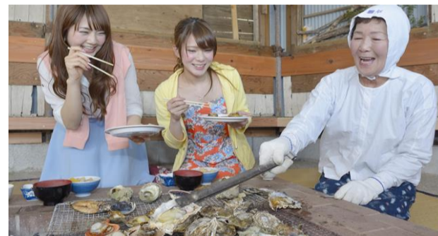
(昼食イメージ)

各開催日 募集人員30名様 最少催行人員15名様 添乗員が同行しますが、バスガイドは同行いたしません。昼食1回付き