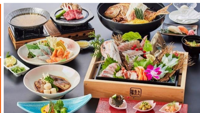
昼食(イメージ) ※お写真は一部2名様盛りとなります

各開催日 募集人員25名様 最少催行人員15名様 添乗員が同行しますが、バスガイドは同行いたしません。昼食1回付き