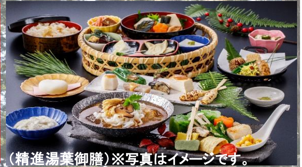
(精進湯葉御膳)※写真はイメージです。

リフレッシュプラン詳細は別紙ご参照ください。 (上記金額はプラン利用しない場合の料金です。)