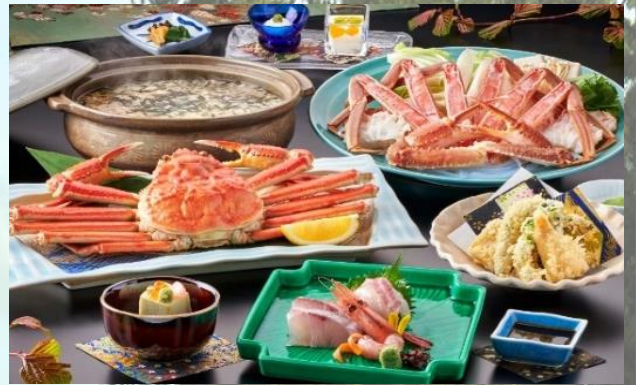
昼食写真(イメージ) 食事内容、器等は変更になる可能性があります。

募集人員: 22名様 最少催行人員15名様 締切日: 12月1日(火) ※添乗員が同行致します。バスガイドは乗車致しません。